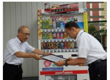
■自動販売機を設置した企業に対して法人から感謝状を送る様子