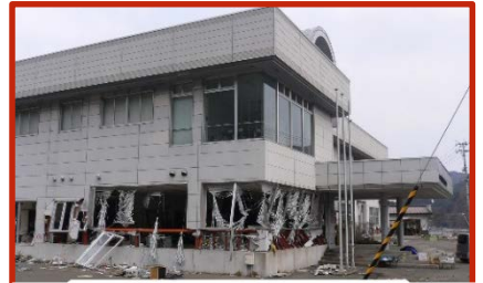
東日本大震災の津波により、1階部分が全壊

平成23年の東日本大震災の津波では、施設が大規模半壊となり、特に1階部分は壊滅的な損傷を受けましたが、「先頭にたって地域振興を進めてほしい」という市民の声により施設を復旧させるとともに、被災中小企業者の復旧・復興を最優先に、グループ補助金の申請支援、かまいしキッチンカープロジェクトの立ち上げ、中古機械設備の斡旋・提供等、復興の拠点と地域の発展のために活動を行いました。平成25年から公益法人として活動しています。