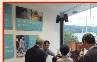
ビジネスマッチングin釜石

また、当日は、釜石・大槌地区と他府県等の企業相互に販路や加工技術について情報交換する「ビジネスマッチングin釜石」の初日でもありました。今回のビジネスマッチングでは、釜石・大槌地区とともに大阪の企業が参加しており、