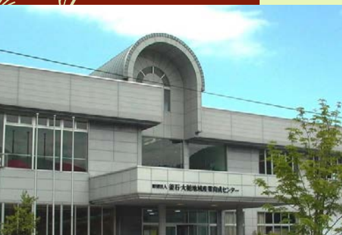
①北海道・東北ブロック (↑) 公益財団法人 釜石・大槌地域産業育成センター 〈東日本大震災後の現在の建物外観〉

毎年秋頃に行われる公益認定等委員会委員と都道府県の合議制機関の委員との意見交換に合わせて、それぞれの地域に根差した事業を行っている法人を訪問しています。今月は北海道・東北及び、東海・北陸ブロックの法人を紹介します。(関連記事4～5ページ)