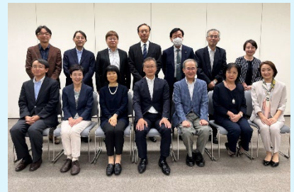
出席委員による集合写真

青森県、岩手県、宮城県、秋田県、山形県、福島県の合議制機関委員及び事務担当者の方々、そして、全体の開催準備で大変お世話になった幹事県である北海道の皆様には、あらためて感謝申し上げます。