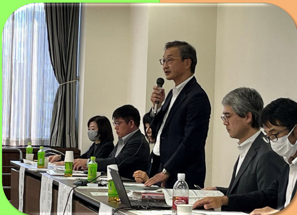
北海道東北ブロック会議