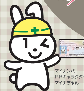
マイナンバー PRキャラクター マイナちゃん