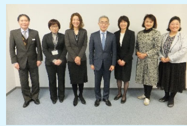
出席者による集合写真

公益社団法人教育・ヘルスケア振興節英会の中重理事、東福事務長、公益財団法人鹿児島県育英財団の西橋常務理事兼事務局長、古園総務係長、石田主査には、あらためて感謝申し上げます。