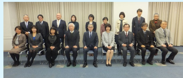
出席委員による集合写真

福岡県、佐賀県、長崎県、熊本県、大分県、宮崎県、沖縄県の合議制機関委員及び事務担当者の方々、そして、全体の開催準備で大変お世話になった幹事県である鹿児島県の皆様には、あらためて感謝申し上げます。