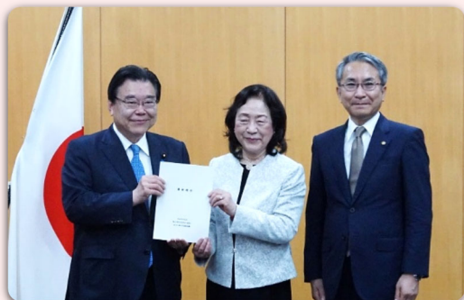
最終報告手交（令和5年6月2日）