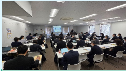
会場の様子@東京(午前)