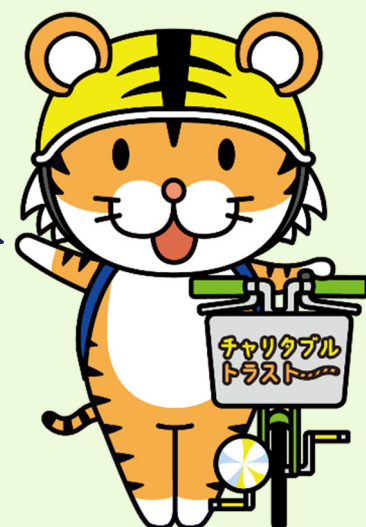
内閣府公益信託イメージキャラクター 「こうえきしんたくん」

各会場御参加いただき、本当に ありがとうございました！ いよいよ4月から新公益信託制度が 始まります。 公益活動の選択肢の1つとして、是非 御活用下さい！