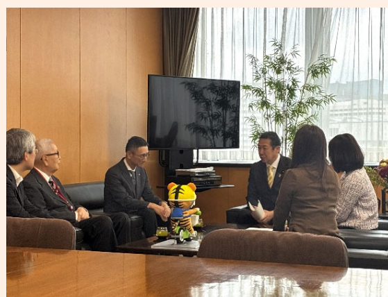
関係者との意見交換